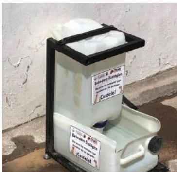
1. Bebedero Ecológico instalado en el parque Mirador de Chihuahua. 11 de agosto de 2021.

En esta orden de ideas, en nuestro país son varios los Estados que se han sumado a esta idea, a saber, el Estado de Oaxaca, que en 2020 ha empezado a instalar comederos para perros callejeros en diversos puntos de la ciudad, todos ellos de materiales reciclados, que han tenido buena aceptación entre la población. 4