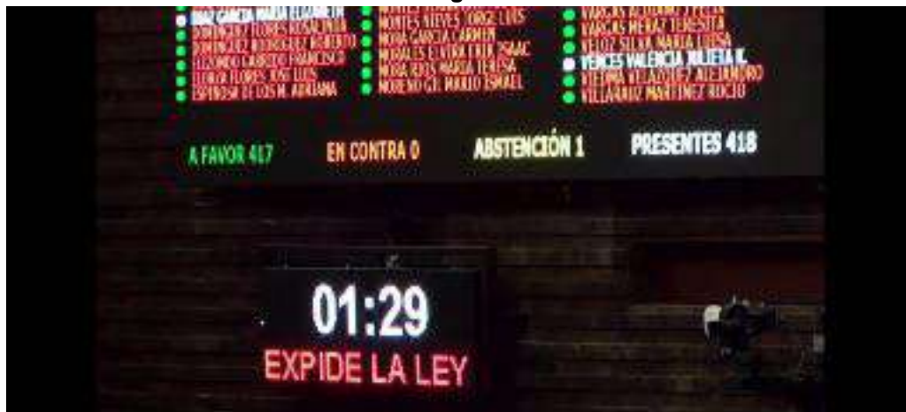
Sesión Ordinaria de la Cámara de Diputados del 6 de abril de 2021.

Cabe mencionar que lo anterior no queda únicamente como una acción propositiva; en el caso de la Cámara de Diputados dentro de su Reglamento se encuentra regulada en su artículo 60, lo cual trae consigo la garantía y continuidad en todo momento en pro de las y los ciudadanos.