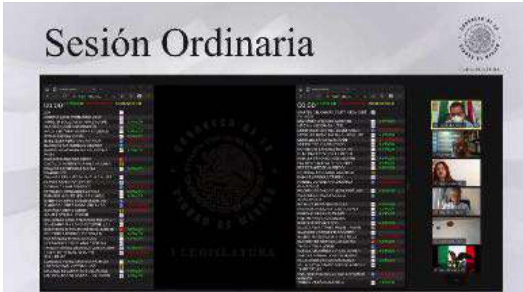
Sesión Ordinaria del Congreso de la Ciudad de México del día 8 de abril de 2021.

El Congreso de la Ciudad de México ha realizado un gran esfuerzo para coadyuvar a generar una ciudadanía informada y participativa en los asuntos públicos que en sus labores se atienden, garantizando que estos se rijan bajo los principios de transparencia, acceso a la información, parlamento abierto y máxima publicidad. En este tenor y bajo lo antes expuesto, es necesario perfeccionar los instrumentos y tecnologías que permitan a la ciudadanía que acude u observa la transmisión de las sesiones del Pleno, Comisiones y Comités, saber sobre el asunto que se está tratando en el momento.