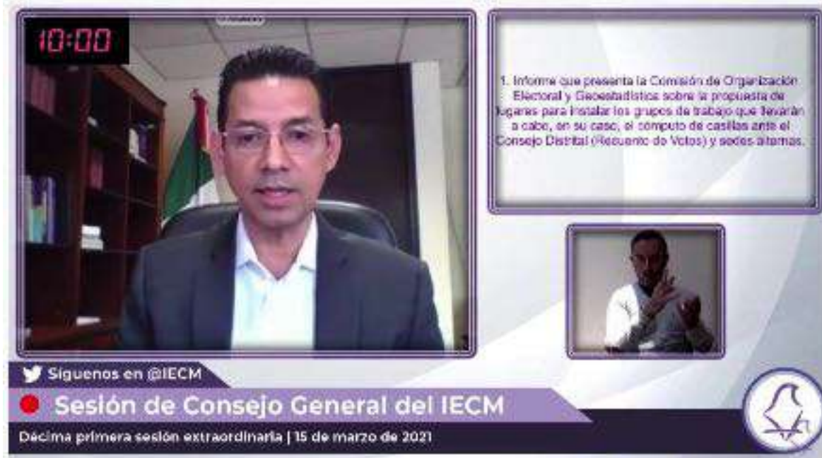
Sesión del Instituto Electoral de la Ciudad de México del 15 de marzo de 2021.

Por lo antes expuesto, es de considerar como una acción viable y pertinente la proyección del título de los asuntos del Orden del Día conforme se vayan tratando, dentro de las sesiones del Pleno y su transmisión; además de que la misma no genera mayor afectación operativa o presupuestaria al propio Congreso, pues se cuenta con las pantallas dentro del Recinto Legislativo ocupadas para el sistema de asistencia y votación electrónica, en donde pueden ser proyectadas; mientras que en las transmisiones en las diversas plataformas de comunicación, no hay mayor complicación en presentar el título de los asuntos del mismo modo en que se proyecta las pantallas digitales de votación, el cuadro de la persona de señas mexicanas o el temporizador de intervenciones.