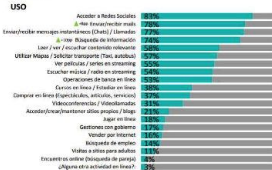
CUADRO 2: Actividades On line.

FUENTE: 13º Estudio sobre los Hábitos de los Usuarios de Internet en México 2017.