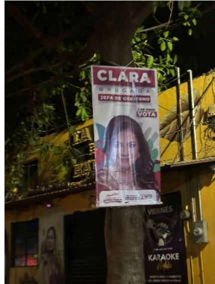
Propaganda electoral colocada en árboles.

Al margen de ello, debe tenerse en cuenta que de acuerdo con la Fundación para el Rescate y Recuperación del Paisaje Urbano, tan solo en la Ciudad de México la propaganda electoral podría generar 25 mil toneladas de basura 1 , por lo que el daño medioambiental es aún mayor. Ello es así porque aunque la ley dispone que la propaganda electoral deberá ser enviada a centros de reciclaje, no toda termina en dichos centros, pues alguna parte de la propaganda electoral ya se ha convertido en basura, antes de que deba ser retirada por el Gobierno de la Ciudad de México o las alcaldías. 2