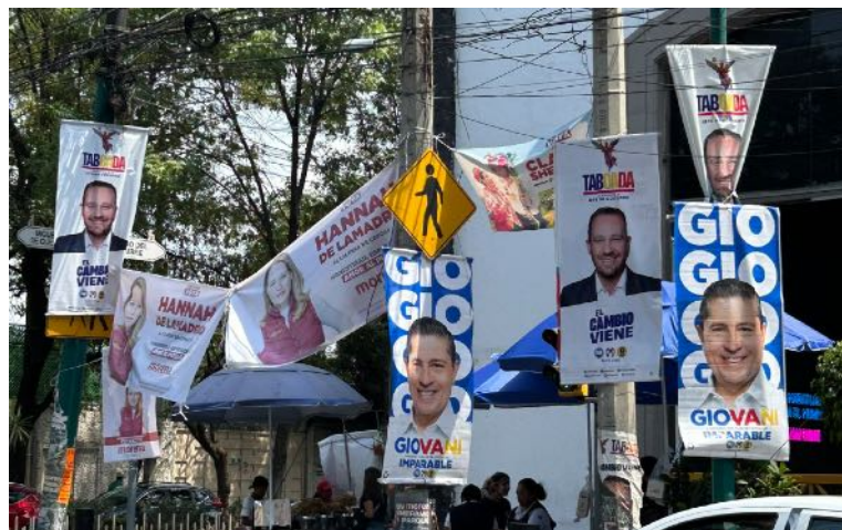
Propaganda electoral colocada de manera que obstruye la vista de señalamientos de seguridad vial.

III. Impacto ambiental. Si bien la legislación electoral prohíbe expresamente la colocación de propaganda electoral en árboles o arbustos, las y los actores políticos no observan esta prohibición, causando un daño directo a los árboles o arbustos en los que se colocan, pues no existe certeza de los materiales ni de las formas que se emplean para tal efecto.