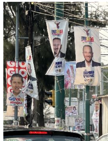
Sobreexplotación del equipamiento y mobiliario urbano para la colocación de la propaganda electoral.