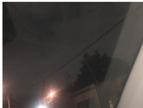
Cuauhtémoc, CDMX