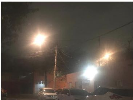
Cuauhtémoc CDMX