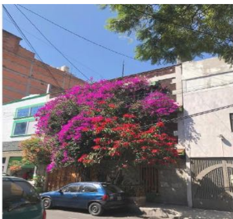
BJ-CDMX