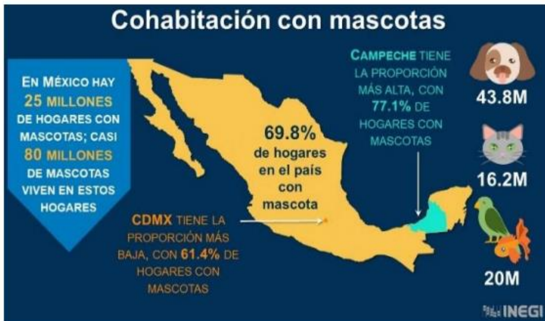
Figura 10. Hogares con mascotas y total de mascotas.

Al respecto, la presentación de esta encuesta explica que “Sin duda las mascotas son una presencia importante en la vida de los hogares mexicanos aunque su significado en términos anímicos parece ser más compleja de lo que pudiera sugerir una mera asociación directa...” 3 .