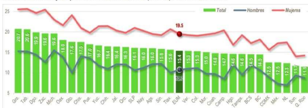
Gráfica 19. Porcentaje de población con síntomas de depresión por entidad federativa.

Prueba de lo anterior, fueron los resultados obtenidos en la ENBIARE 2021, en donde la población con sistemas de depresión asciende a 15.4% ; en el caso de las mujeres la proporción asciende considerablemente a 19.5% ; posicionando a Guerrero, Tabasco y Durango como las Entidades Federativas con los porcentajes más altos y en su otro extremo a Quintana Roo, Sonora y Nuevo León.