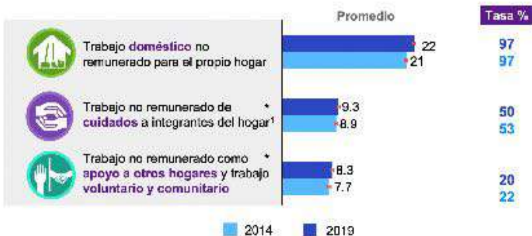
Promedio de horas a la semana de la población de 12 años y más que realiza trabajo no remunerado y tasas de participación, por tipo de actividad de trabajo no remunerado, 2014 y 2019

Del tiempo total de trabajo a la semana, de la población de 12 años y más, prácticamente 5 de cada 10 horas contribuyen a la economía del país sin que medie pago alguno por ello. La ENUT 2019 del Inegi encontró que a nivel nacional, el promedio de horas a la semana que una persona de 12 o más años dedica al trabajo no remunerado es de hasta 22. Si consideramos sólo la Ciudad de México, el promedio de horas semanales dedicadas al trabajo no remunerado es de 28; y, desagregado por sexo, el trabajo no remunerado se ha estimado en 37.3 horas semanales para las mujeres y 17.9 para los hombres.