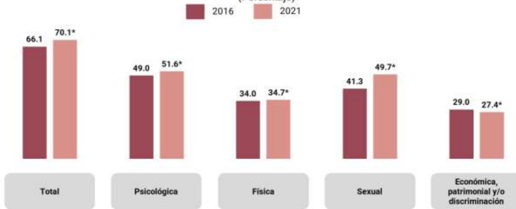
Gráfica 1 PREVALENCIA DE VIOLENCIA CONTRA LAS MUJERES DE 15 AÑOS Y MÁS A LO LARGO DE LA VIDA POR TIPO DE VIOLENCIA, SEGÚN AÑO DE LA ENCUESTA (Porcentaje)

*El cambio entre las dos encuestas es estadísticamente significativo.