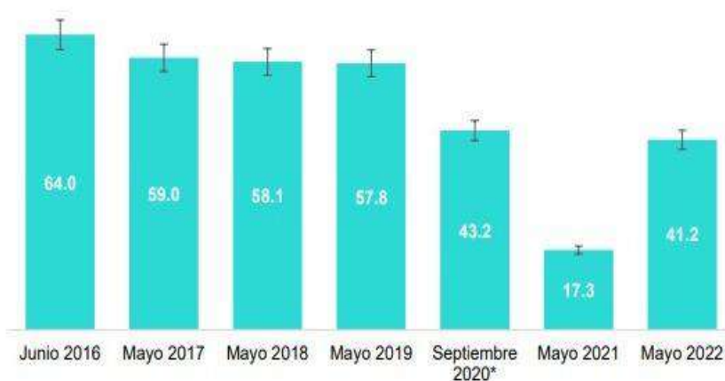
Gráfica 1 POBLACIÓN QUE ASISTIÓ A ALGÚN EVENTO CULTURAL SELECCIONADO 1 (Porcentaje)

Específicamente, en términos de conciertos musicales, México es el mercado más grande de América Latina con ingresos de $316 millones de dólares en 2019, último año pre pandémico. Para el presente año, de acuerdo con el Módulo sobre Eventos Culturales Seleccionados (MODECULT) 2022 del Instituto Nacional de Estadística y Geografía (INEGI) en 2022, el 41.2% del total de la población mexicana declaró haber asistido a alguna obra de teatro, concierto o presentación de música en vivo, espectáculo de danza, exposición, proyección de películas o cine durante los últimos 12 meses , lo que representa una recuperación de 24 puntos porcentuales respecto a 2021. 2