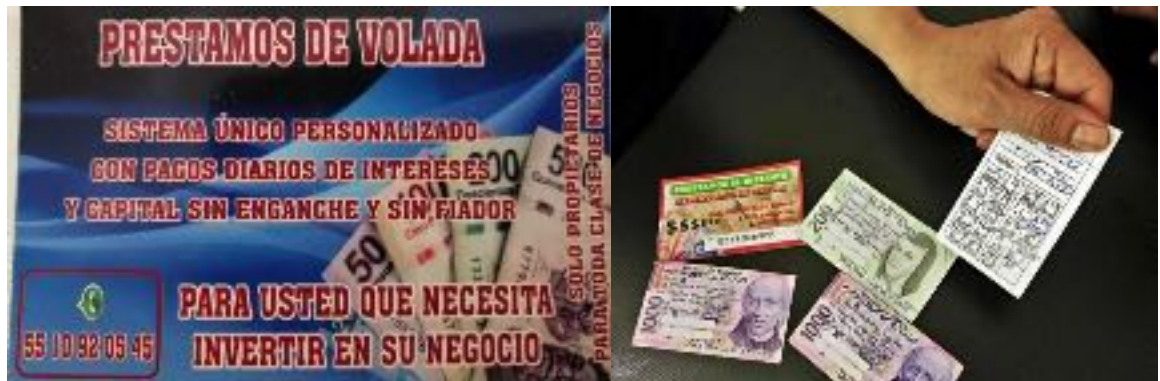
Imágenes de las tarjetas donde se ofrecen préstamos, para posteriormente después de, cobrar intereses muy por encima de lo otorgado.

Cabe decir que, según la ley, por un préstamo se debe cobrar alrededor del 6% anual, pues de otra manera se considera "usura" y esta práctica está penada por la ley.