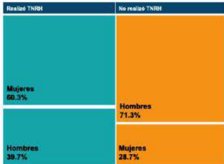
Gráfica 1.- CDMX, Población de 12 años y más* por condición de realización de trabajo no remunerado del hogar (TNRH) según sexo, 2015

*Nota: Se excluyen a aquellas personas que no especifican condición de TNRH.