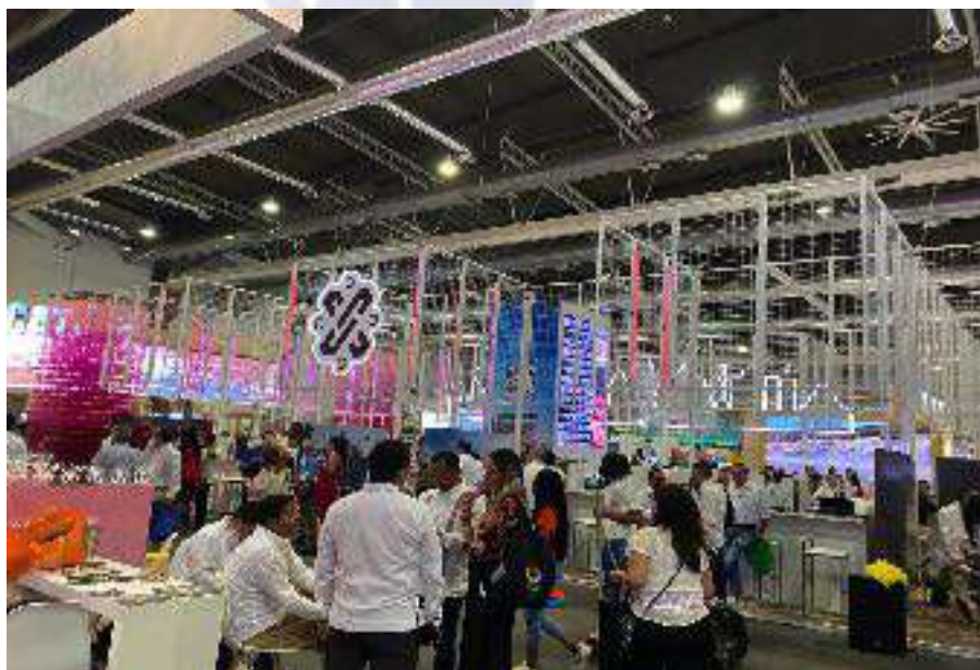
“Tianguis Turístico México 2022”

Por lo antes expuesto, este fideicomiso ha hecho un esfuerzo “mínimo” en llevar a cabo dichas funciones tendientes a la realización de acciones que den promoción, publicidad, fomento y difusión de la industria turística de la capital, siendo claros los ejemplos del “Tianguis Turístico México 2022” y la “FITUR 2022”, en donde lejos de dejar en alto a la Ciudad de México dentro de la industria, se mostró un esfuerzo mínimo y conformista en cuanto a los montajes y producción de dichos “Pabellones”, pudiéndose apreciar el poco ejercicio de recursos del Fideicomiso en este rubro, siendo el más importante, la desaparición de la marca CDMX como símbolo del turismo en esta capital. En el mismo sentido, diversos medios de comunicación, así como participantes y asistentes han denunciado en redes sociales que en dichos eventos, existe falta de personal y atención, así como materia de información, difusión y publicidad, tales como folletos, trípticos, tarjetas entre otras herramientas de publicidad.