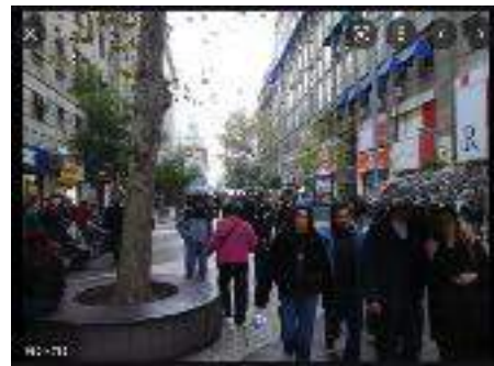
Calle Huérfanos en Santiago de Chile.

Ante la realidad que se muestra en la imagen de la izquierda, en las ciudades de la República de Chile, las autoridades señalaron la importancia de contar con políticas que (...) que resalten las bellezas de las ciudades con el fin de mejorar la calidad de vida de los ciudadanos. En consecuencia, fue importante que las empresas de telecomunicaciones tuvieran orden y realizaran el retiro de líneas aéreas y subterráneas de cables en desuso (imagen de la derecha)... 3