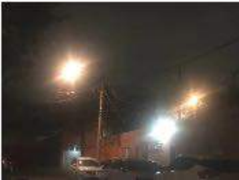
Cuauhtémoc CDMX

Esta es la imagen habitual de cualquier calle de la ciudad de México: